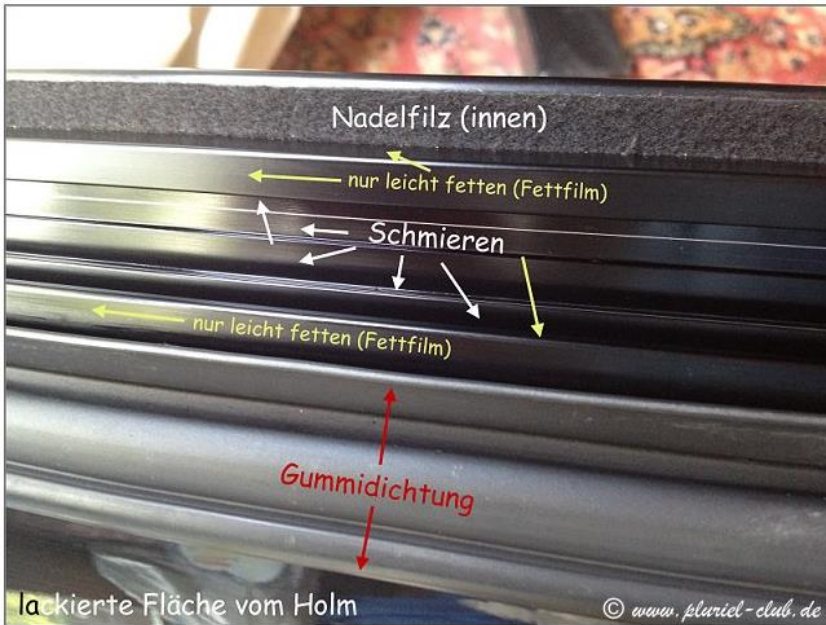
Holmansicht von oben. Weiss: schmieren. Rot: nicht schmieren.

• Hochleistungs-Haftschmierstoff für die Dachführungen in den Holmen: Muss temperaturbeständig sein. Zum Beispiel: Beco TecLine Haftschmierstoff https://www.amazon.de/dp/B0021CMZ06/ wird aufgesprüht. Wenn das Lösungsmittel verdunstet ist, wird es fest und haftet und schmiert sehr gut. Holme abnehmen für das Schmieren der Führungen!